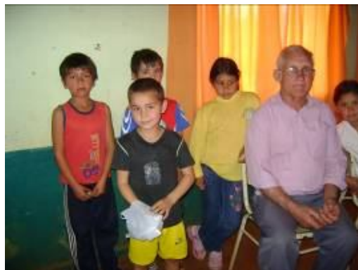
Los alumnos mas chiquitos tambien asistieron