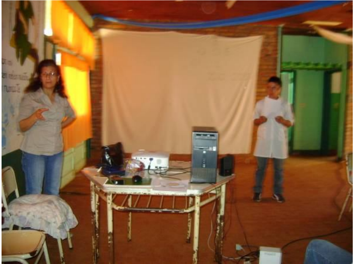
Encuentro de alumnos que participaron en el proyecto en la Facultad de Humanidades y Ciencias Sociales