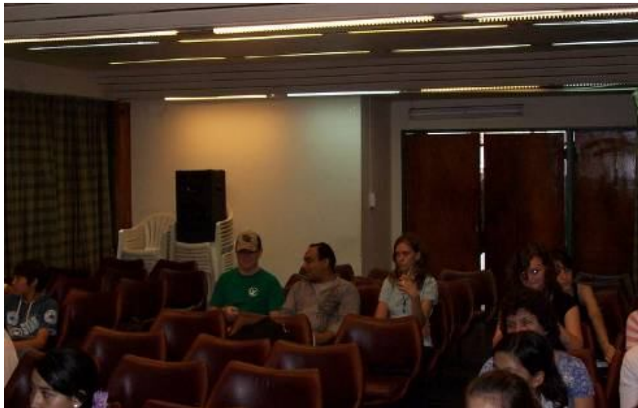
Alumnos y docentes participantes