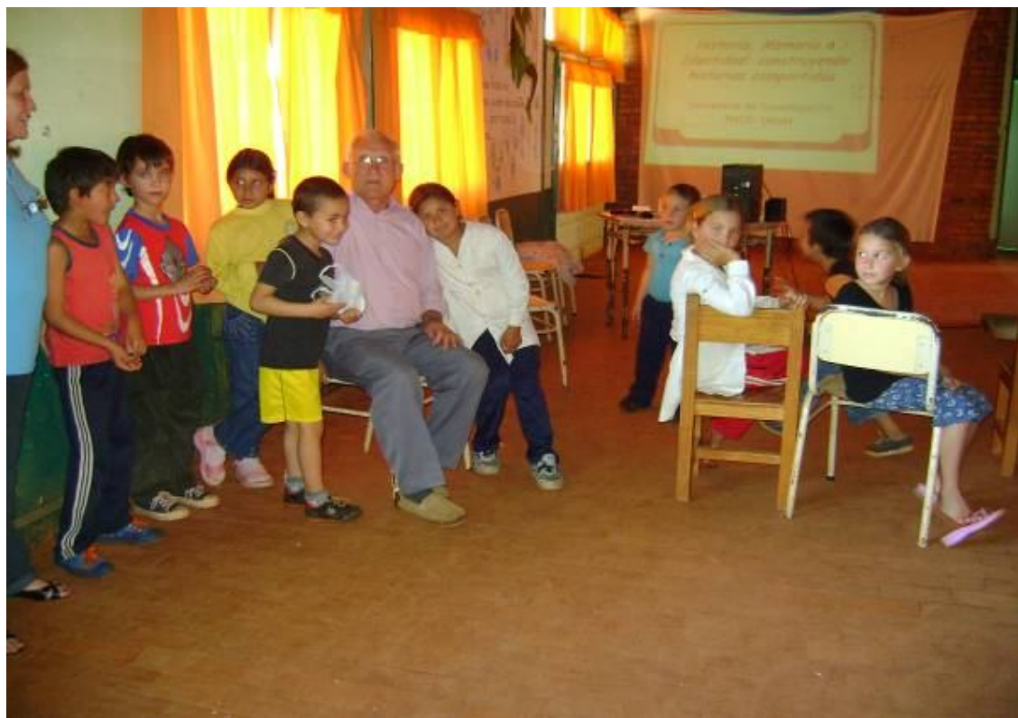
Taller de entrevistas en Colonia Paraíso