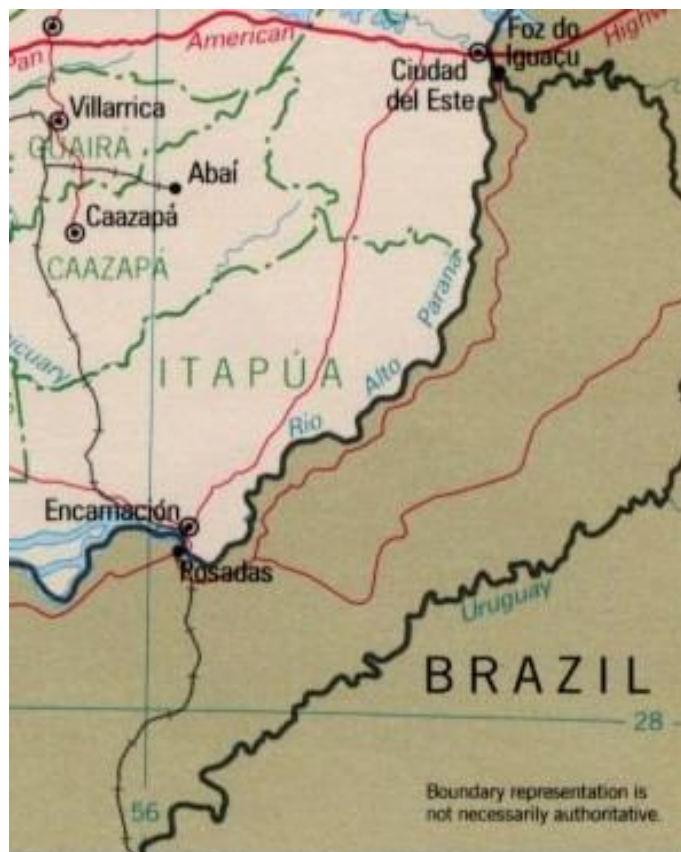
Mapa 1. Misiones Argentina –Región fronteriza

Es parte de un proceso de cotidianidades migratorias de gente de frontera en el “lugar” ubicado entre dos ciudades y países limítrofes: Encarnación perteneciente al Departamento de Itapúa de la República de Paraguay y Posadas, capital de la Provincia de Misiones de la República Argentina.